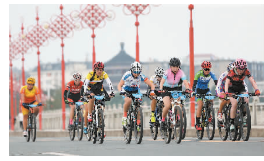
一路骑行,风景如画。