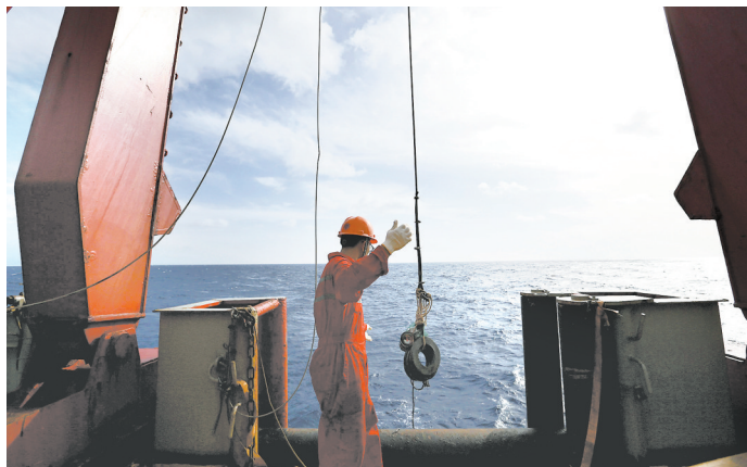
“雪龙”号船员在进行地质绞车钢缆保养(2月28日摄)。

北京时间3月4日凌晨3时28分，“雪龙”号极地考察船载着中国第35次南极科考队队员，由东经107度01分穿越赤道，返回北半球。