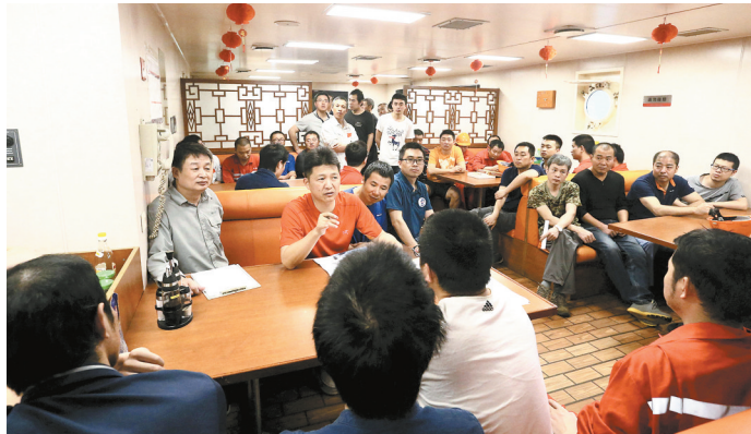
“雪龙”号船上开会部署防海盗行窃(3月1日摄)。