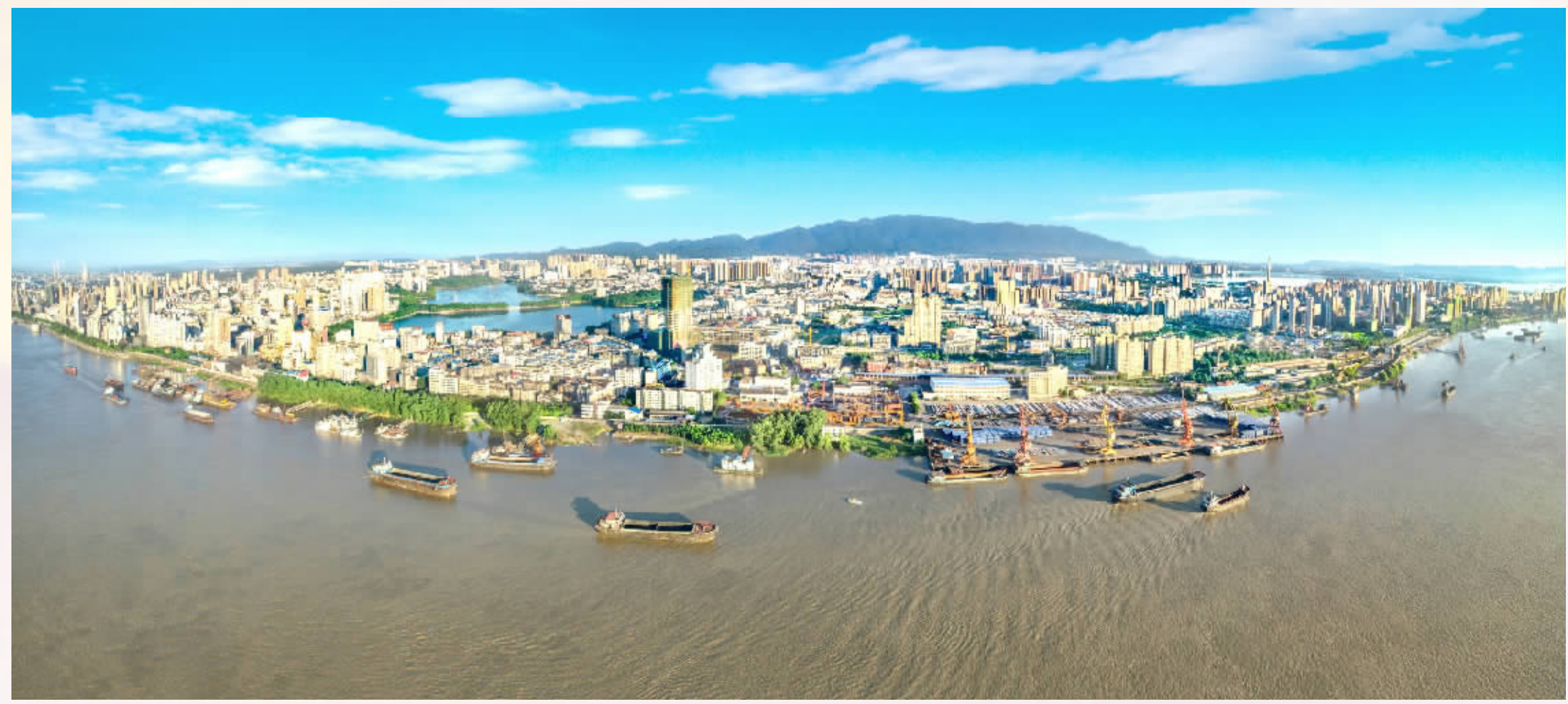
美丽的九江。