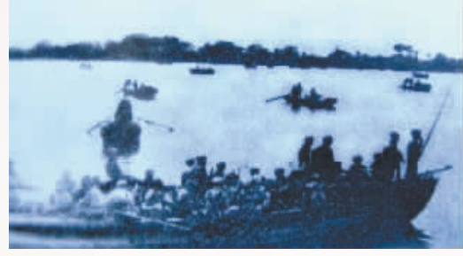
当年的渡江现场。(资料图片)

一段岁月，波澜壮阔，刻骨铭心。一种精神，穿越百年，耀耀未来。70年前，人民解放军百万大军，西起九江，东至江阴，冲出敌阵，横渡长江，千里国民党政权防线全部崩溃。渡江战役的胜利和南京解放，标志着蒋家王朝的覆灭，为解放全中国、建立中华人民共和国奠定了坚实基础。 为庆祝渡江战役胜利70周年和新中国成立70周年，由南京日报联合当年渡江战役涉及的长江中下游九江、铜陵、芜湖、滁州、常州、镇江、江阴等城市的党报，共同发起了“寻迹百万雄师过大江——长江沿线8市党报全媒体行动”，追寻70年前人民解放军百万雄师的渡江足迹，记录70年砥砺前行、长江两岸发生的天翻地覆变化。 今起，8市党报将同步推出《寻迹百万雄师过大江——长江沿线8市党报全媒体行动》特别报道。