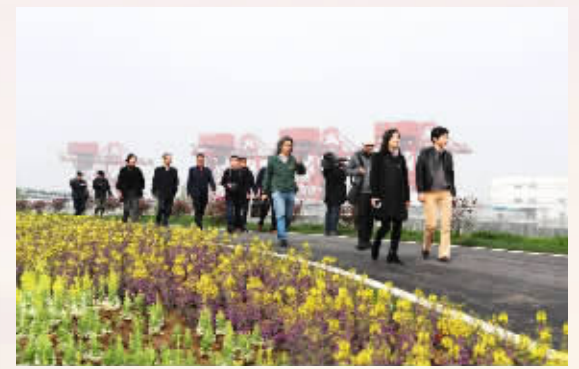
行走在长江最美岸线湖口段。