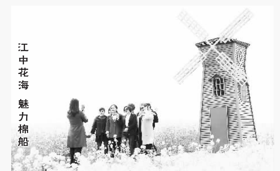
江中花海魅力棉船

游千年石钟，赏江湖两色。今年清明节假期天气晴好，长江和鄱阳湖交汇处浔阳分明，满眼葱茏、春意盎然的石钟山风景区迎来旅游热，游人如织。