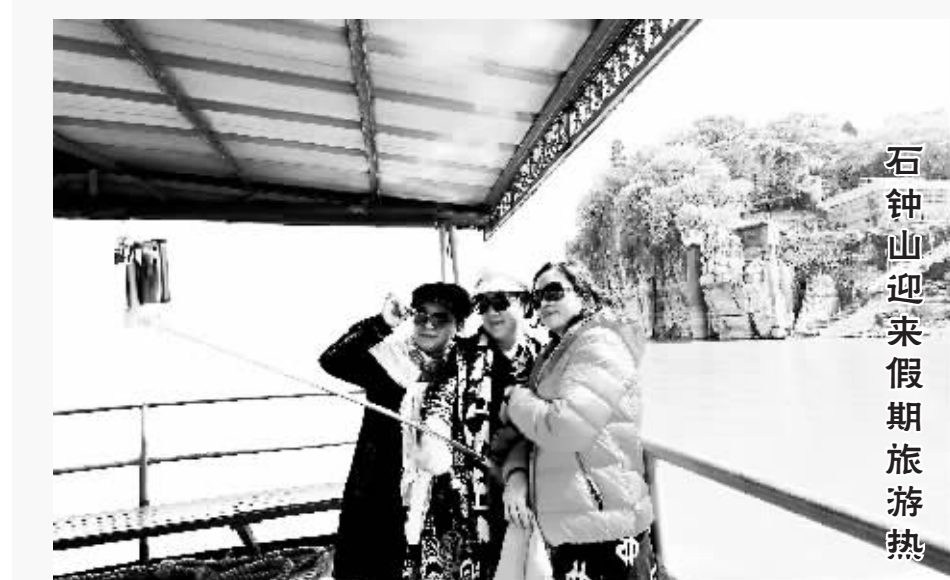
石钟山迎来假期旅游热

游千年石钟，赏江湖两色。今年清明节假期天气晴好，长江和鄱阳湖交汇处浔阳分明，满眼葱茏、春意盎然的石钟山风景区迎来旅游热，游人如织。