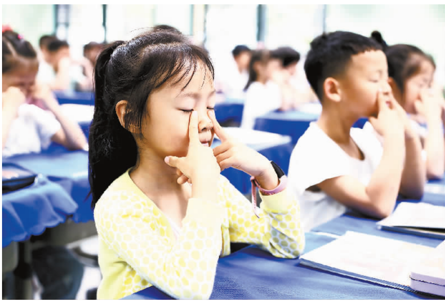
图为九江小学八里湖校区的学生们正在认真做眼保健操。

“自国家综合防控方案实施以来，我们已经按省教育厅的要求，对九江浔阳区、濂溪区、武宁县三个地方的学校学生进行抽样视力筛查，近视率低于国家公布的近视率水平，全体学生视力筛查工作即将出台工作方案，不久将进入实施阶段。我们和市卫健委正在着手研究出台九江市综合防控儿童青少年近视实施方案，进一步细化各项工作。前期，卫健部门还组织