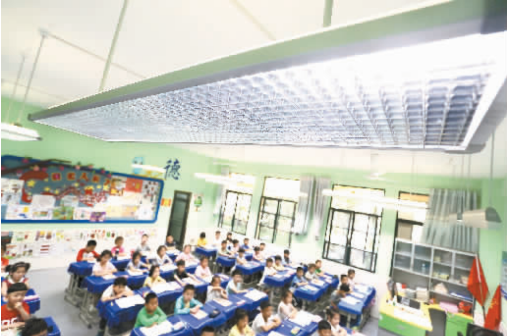
为保护学生视力，九江小学八里湖校区在多个教室安装了护眼灯。

欧阳君强调，近视是无法治愈的，必须采取正确的应对策略，即“以防为主、防控结合”，利用科学的技术方法，预防近视的发病，控制近视的发展速度。他建议儿童青少年应养成良好的用眼卫生习惯，例如：采用正确的读写姿势，避免过度用眼，适时休息，少看甚至不看电视、手机、平板电脑等；改善用眼环境，如创造舒适的室内光照环境；并增加户外活动的时间，达到平均每天2小时，就能有效降低发生近视的几率。