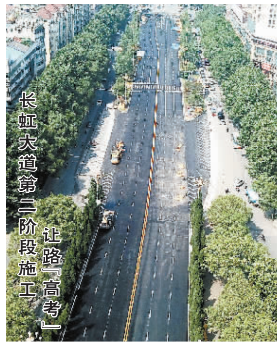
6月3日,长虹大道“白改黑”工程长虹北路至南湖支路(不含路口)段正在道路标线作业,第一阶段施工于当天基本完工。为了保障高考期间交通畅通,原定于6月3日至6月17日的第二阶段施工延后至6月9日开始。第二阶段施工开始后,长虹大道青年路至十里大道段主道(不含青年路路口)将封道。

据了解,今年柴桑区共有考生2640人,其中普通考生2580人,三校生60人,设有柴桑区一中、柴桑区二中2个考点,共76个考场,考场全部按照全国统一考试标准设置。