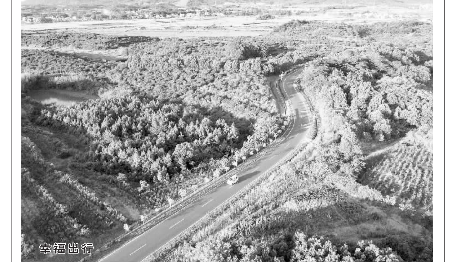
幸福出行 近年来,湖口县始终将“四好农村路”建设作为一项重要的民生工程,从建好、管好、护好、运营好四个方面精准发力,强力推进“四好农村路”建设,切实为广大农村群众建好便民路、致富路、幸福路,为高质量打赢脱贫攻坚战、全面建成小康社会提供最坚实的交通保障。图为8月30日,湖口县武山镇王常村村民在“四好农村路”上幸福出行。

本报讯(记者高明磊)9月3日省政府新闻办新闻发布会举行2019年江西省“全国科普日”主场活动新闻发布会。省科协副主席宋平岗发布和介绍有关情况,副市长李军出席发布会,并答记者问。 据了解,2019年江西省全国科普日主题为“礼赞共和国、智慧新生活”,将在全省各地集中开展。今年的主场活动将于9月14日-16日在九江举办,届时,将有一系列丰富多彩的表演形式,满足广大科技爱好者与科技亲密接触和互动体验需求。 宋平岗介绍,今年的主场活动开幕式将于9月15日在九江市文化艺术中心举行。广泛开展全省科普主题活动,围绕公众关注的热点开展公共科普服务,在全省上下营造了爱科学、学科学、讲科学、用科学的浓厚氛围,进一步拓宽了公民科学素质建设渠道,提升了科普公共服务能力。 李军表示,2019年江西省“全国科普日”主场活动的举办,是提升我市民科学素质的重要契机,将为九江科技领先、转型发展,加快新旧动能转换、推进科普事业发挥积极促进作用。