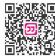
(扫码下载客户端,看更多新闻)