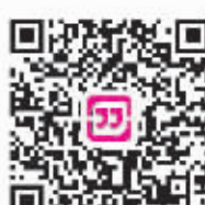
更多详情扫码捐款通道也在此