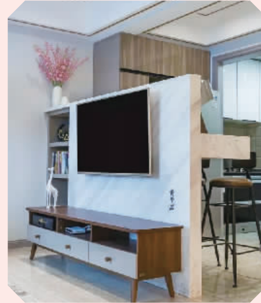
电视柜+餐边柜隔断 利用电视柜、屏风和餐边柜围出了一个餐厅，在隔断的同时还能做很多收纳。