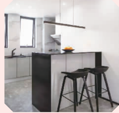
吧台隔断 吧台和酒柜、收纳柜一体化设计，充分利用了空间。