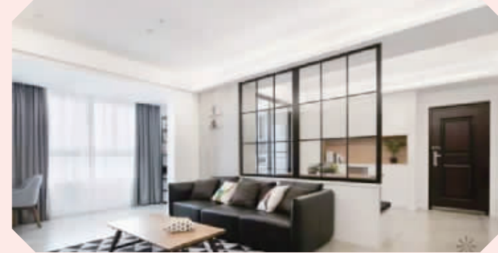
玻璃隔断 一物两用，既能作为隔断也能当镜子。镜子让空间仿佛大了一倍，用在小户型中也很好。

空间的合理划分，对于家居生活和谐指数相当重要。隔断绝对不仅仅是划分空间，一款好的隔断设计能在一定程度上决定家居的美貌指数。