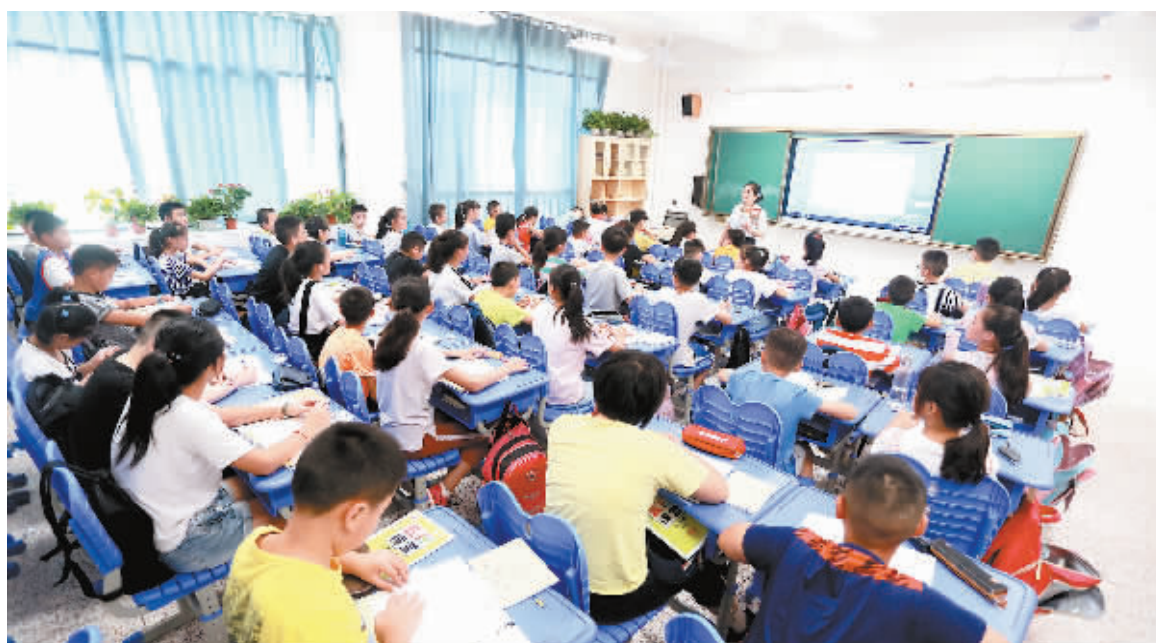
浔东小学新教学楼内,每个教室都配备了电子白板、云端投影设备。

呆得最多的地方,一周有三次晚自习,三次专业课都需要在美术教室里完成,一呆就是半天时间。市六中高二年级美术教师姜倩告诉记者,新教室光线好,设施好,美术生东西多,教室里还配备了专门的储物柜,新学期听说要搬进新的美术教室,学生们都高兴得不得了。