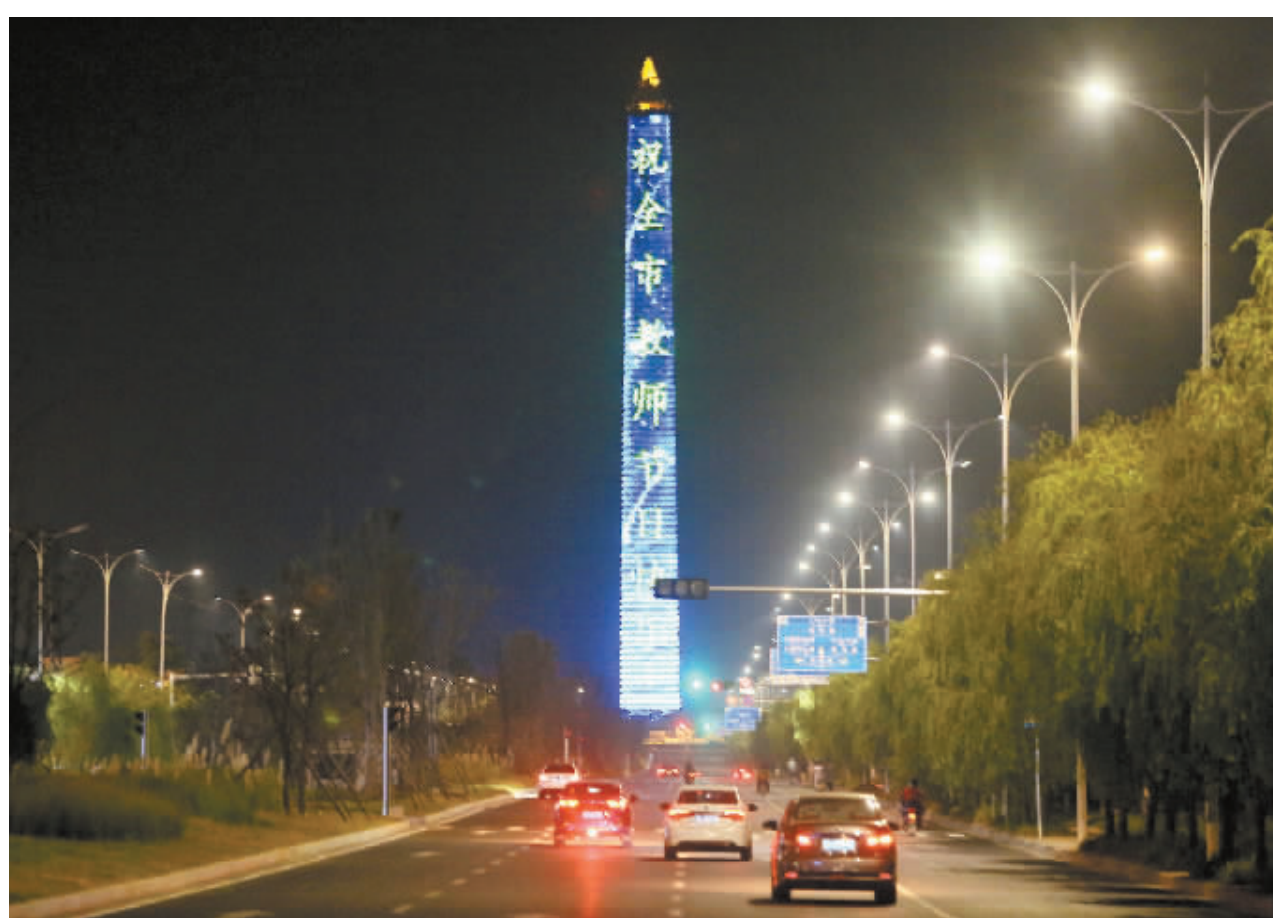
9月10日晚,我市标志性建筑胜利碑上滚动播出了多条教师节祝福语,向教师们致敬。

据悉,“2019年全国节约用水知识大赛”分两个阶段,第一阶段为知识普及阶段,时间为8月30日~9月10日,组委会通过水利部网站、全国节约用水办公室网站、水利部官方微信公众号“中国水利”和全国节约用水知识大赛微信服务号开展节水知识普及。第二阶段为线上答题竞赛阶段,时间为9月11日~10月10日,参与答题者可分别通过水利部官方网站和全国节水办官方网站答题专区,水利部官方微信公众号、全国节约用水知识大赛微信服务号等网络渠道参与有奖答题。线上答题竞赛期间,在全国节约用水知识大赛微信公众号上答题且正确率为100%的参与者将有机会领取红包;在水利部网站专区上答题且正确率为100%的参与者将获取抽奖机会,一等奖20名各奖800元,二等奖80名各奖300元,三等奖200名各奖100元。