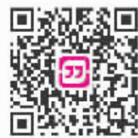
(扫码下载客户端,看更多新闻)