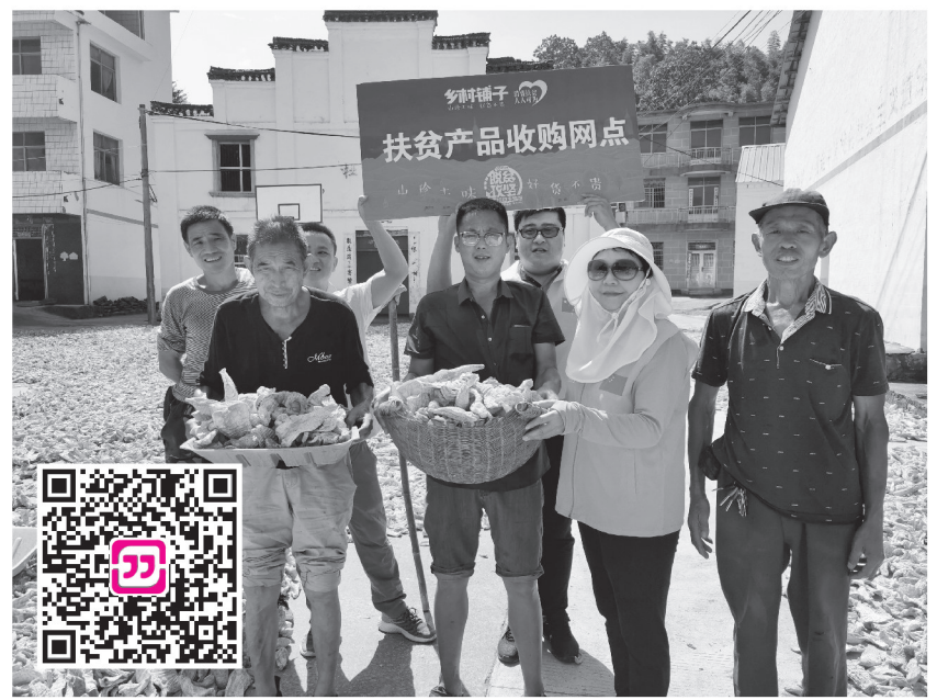
扫码购买 瑞昌市横立山乡的村民晒笋干准备售卖。

我们中国人,一向对竹子有特殊的情感,认为它是高洁、脱俗的精神象征。自古以来,文人墨客对它的褒扬就不少,北宋大文人苏东坡甚至直白地写过“无肉使人瘦,无竹令人俗”。