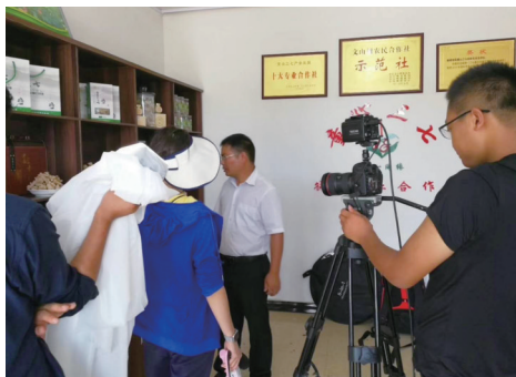
北京电视台为童心三七合作社宣传

三七对生态环境有着特殊要求,适宜种植的地区仅分布于六诏山脉下的很小一部分地方。文山地处云南省东南部低纬度高原,属亚热带季风气候,大部地区冬无严寒,夏无酷暑,春秋长,冬夏短,四季气候宜人,整体气候通常是“一年有冷热,久雨变成秋;冬晴如春暖,惊蛰有冬寒”,正适合种植三七。其他地方也曾引种过三七,但无论外观性状还是在质量,都不能和文山三七相比,相差不是一星半点。