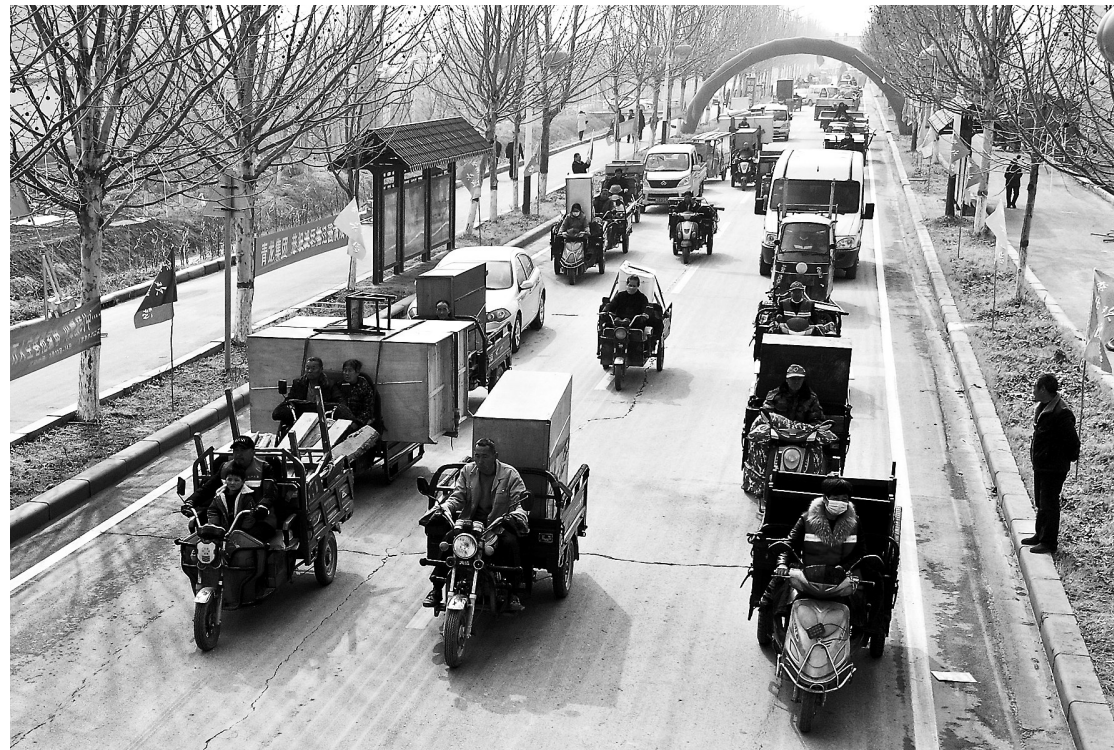
封丘县李庄镇的搬家车队驶向新区。