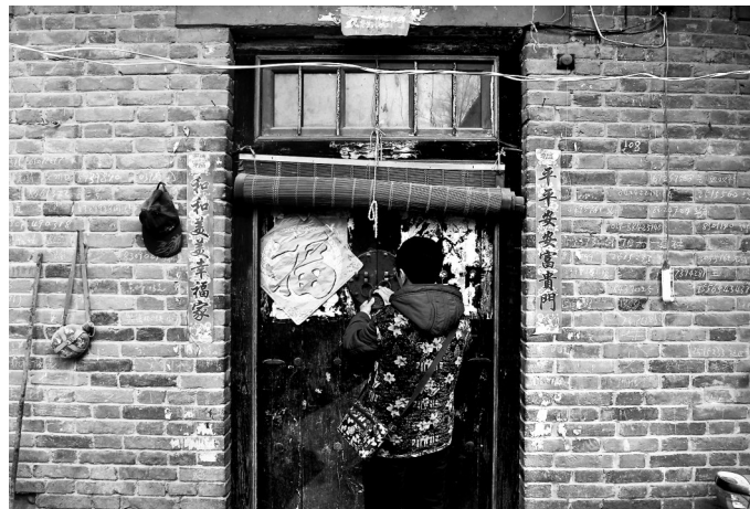
在搬完东西后,杨明兰锁上老房子的门。