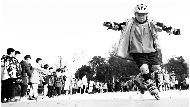
▲合肥市少儿艺术学校的学生进行轮滑课程展示。