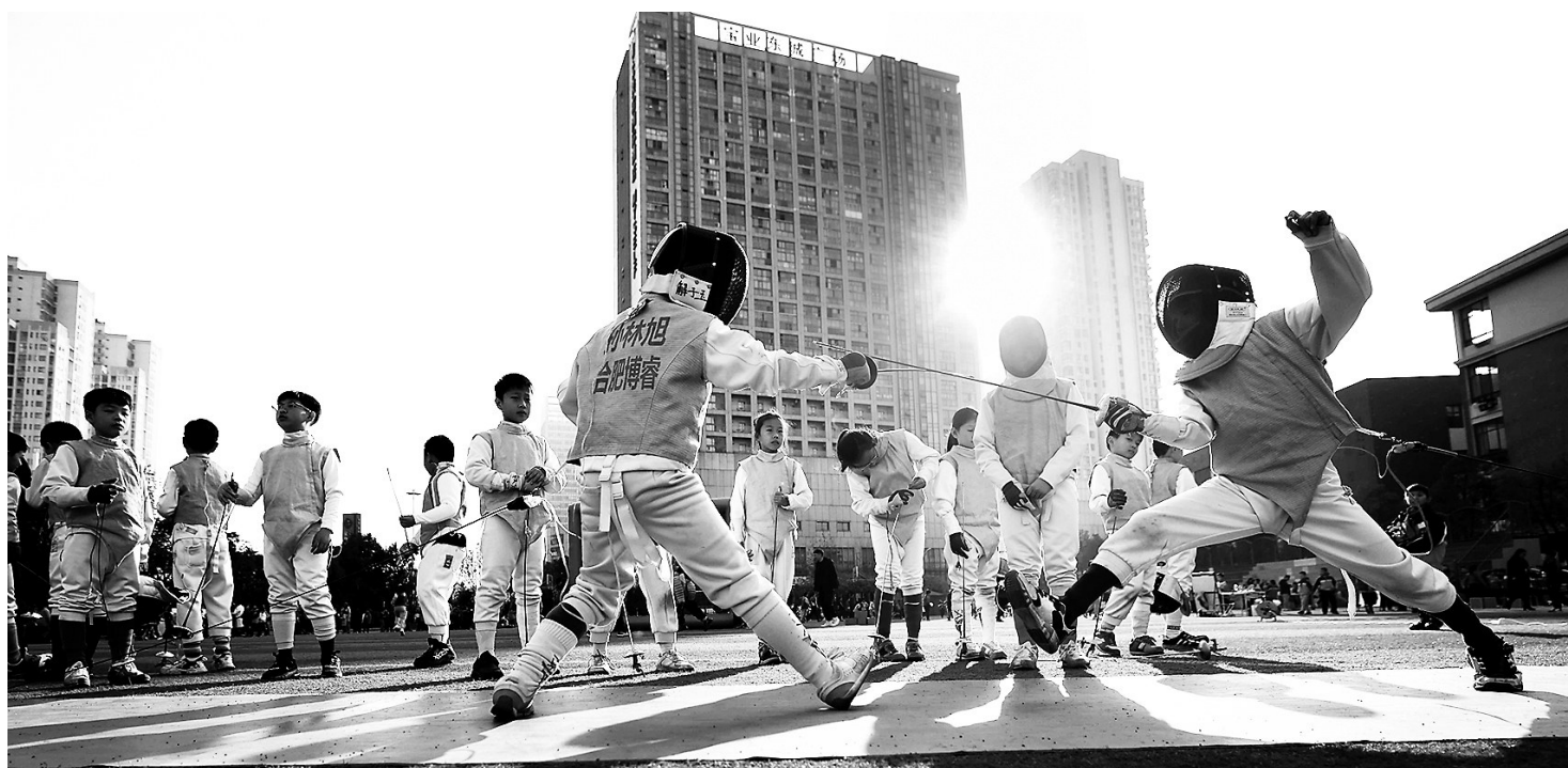
▲在合肥市少儿艺术学校,学生进行击剑课程展示。