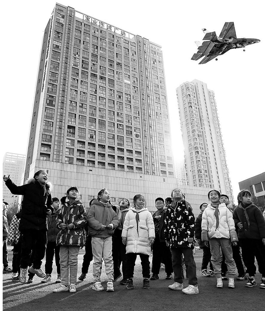
▲在合肥市少儿艺术学校,学生进行航模课程展示。