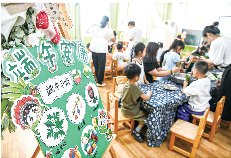
▲6月19日,在河北省邯郸市广平县第四幼儿园,小朋友在家长的帮助下学习包粽子。