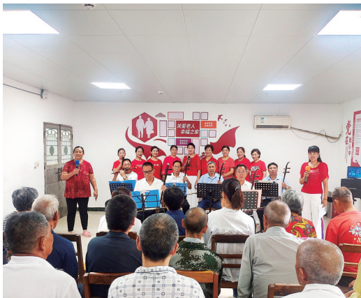
“夕阳”动情 歌舞动听 9月3日,柴桑区港口街夕阳红红歌队队员带着精心准备的12个节目,到港口敬老院老人们联欢。或歌舞,或乐器演奏,现场气氛热烈。红歌队演唱《浏阳河》把活动带入高潮,不少老人兴致盎然即席登台表演。通过此次慰问演出,大大丰富了老人们的生活。

本报(记者张新红)近日,浔阳区人民路街道开展“爱心助学 携手慈善”慈善暨新时代好少年表彰活动,15名大学生接受捐助,44名“三优”少年获奖。 随着新学期开学,诸多学子纷纷回校读书,为让贫困学子顺利完成学业,浔阳区人民路街道号召辖区爱心人士和企业伸出援手,并在街道办一楼会议室开展募捐活动。活动现场,浔阳区关工委主任带头捐款,爱心企业经理祁先生捐款1000元,来自人民路街道各社区的“五老”也纷纷慷慨解囊,为帮助贫困学子尽一份力。 当日,参加活动的全体学子在浔阳区人民路街道关工委主任的带领下,齐声诵读家风家训。现场15名大学生接受爱心捐助。大学生代表吴佳佳微现场与中小学生们分享学习心得,鼓励大家努力学习,不断进步。在精彩的评书、演唱节目之后,44名“三优”少年上台接受表彰。“三优”少年祁炜皓表示,要做一名优秀的少先队员,热爱集体,关心他人。 在互动抽奖环节,九江送出了制作精美的特色文创产品,沈家鱼、梁义隆桂花茶饼、思哥糟鱼、溢流山药糕酥……既蕴含了深厚文化底蕴,又寄托了与杭州的深厚情谊。活动现场,九江带来的特色美食产品也引得众人驻足品尝。