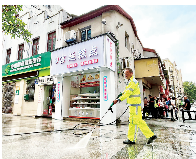
洁净城市 9月1日,市区大中路步行街,环卫工人正在清洗路面,为城市“梳妆美容”,营造良好的城市面貌和生活环境。

本报(记者吴金阳)为持续推动移风易俗工作,倡导“绿色环保 文明低碳”理念,近日,市文明办联合浔阳区延支山社区新时代文明实践站开展“持续深入移风易俗 垃圾分类树新风”主题宣传活动。 活动现场,社区志愿者用生动形象的语言详细讲解了垃圾分类的知识,依次介绍可回收物、厨余垃圾、有害垃圾和其他垃圾的分类标准和投放方式,向居民传递环保理念。志愿者们还上门向辖区居民发放垃圾分类宣传页、倡议书等宣传资料,引导居民正确进行垃圾分类,让居民主动参与到生活垃圾分类行动中。辖区居民纷纷表示,要在今后生活中从小事做起,进行垃圾分类,自觉爱护社区环境。 社区工作人员表示,将持续开展垃圾分类宣传,提升居民爱护环境的意识,引导居民践行文明新风尚,共建美好家园。