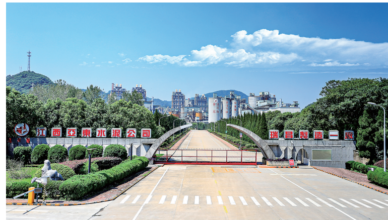
江西亚东水泥有限公司,点石成“金”,向“绿”而行。