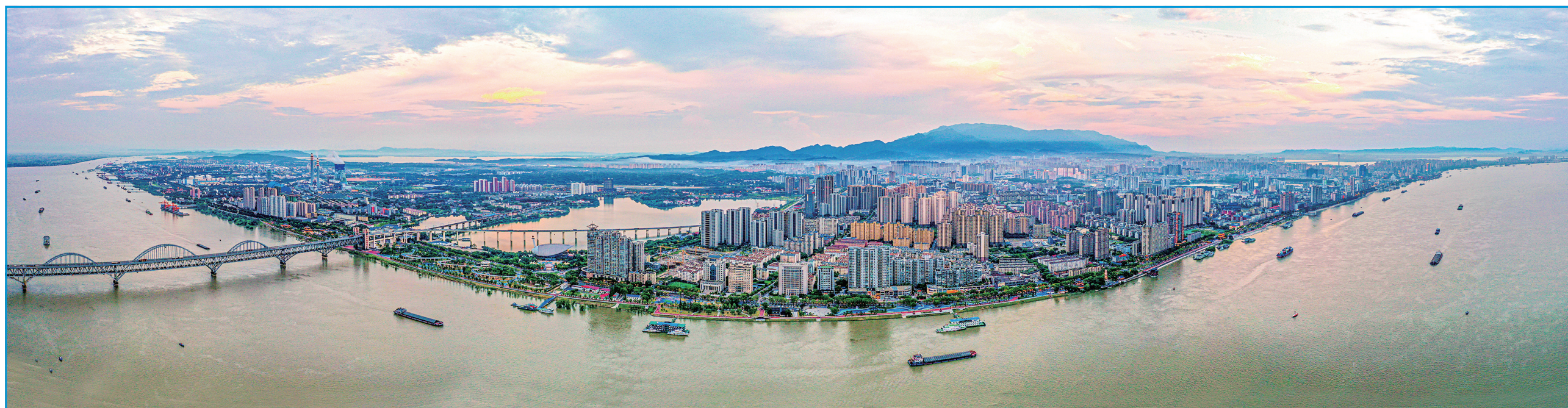
有152公里长最美长江岸线的九江,正在高标准高质量建设长江经济带重要节点城市。