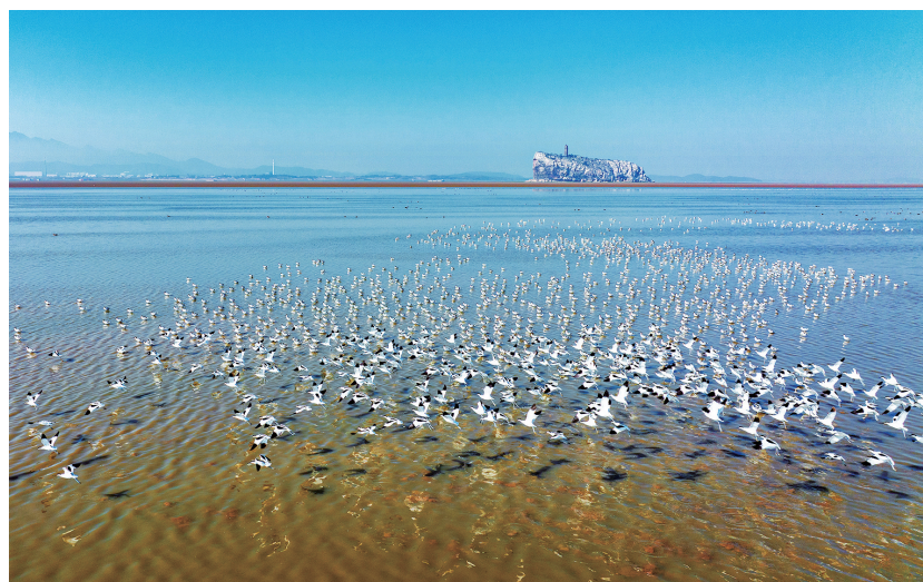
候鸟的天堂——鄱阳湖。