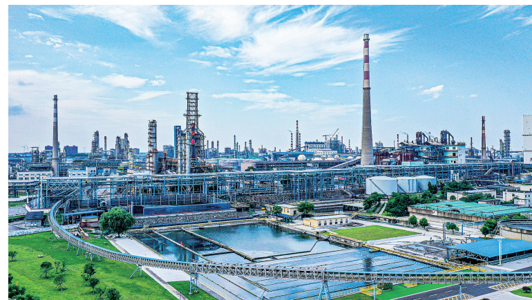
九江石化倾力打造世界领先、绿色智能炼化一体化企业。

位于万里长江、千里京九、百里鄱阳湖交汇点的九江,深入贯彻落实习近平总书记考察江西重要讲话精神,聚焦“走在前、勇争先、善作为”的目标要求,牢牢把握高质量发展这个首要任务,深入实施制造业、文旅、基础设施“三大攻坚行动”,加快打造区域制造业中心、区域文旅中心和区域航运中心,建设富裕美丽文明和谐幸福的美好家园,奋力迈出了高标准高质量建设长江经济带重要节点城市的坚实步伐。