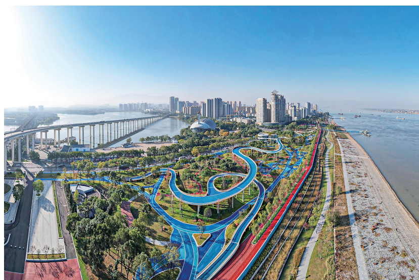
长江国家文化公园九江城区段。