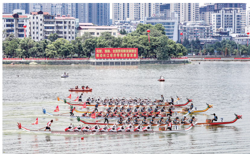
改造好的“两湖”,成为龙舟竞渡、市民休闲的好去处。