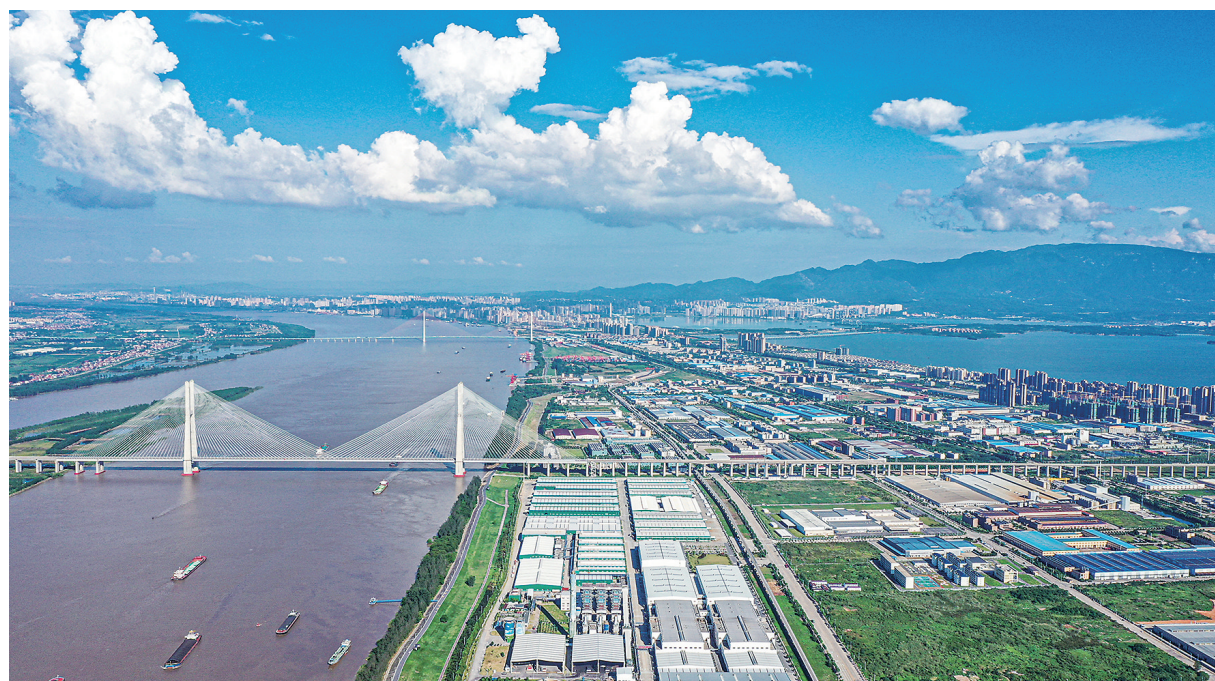
九江经开区城西片区。