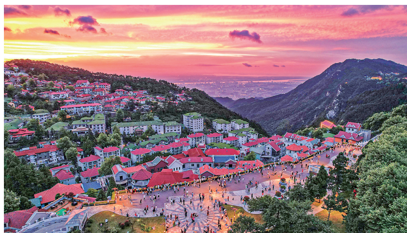
夏日庐山,避暑天堂。