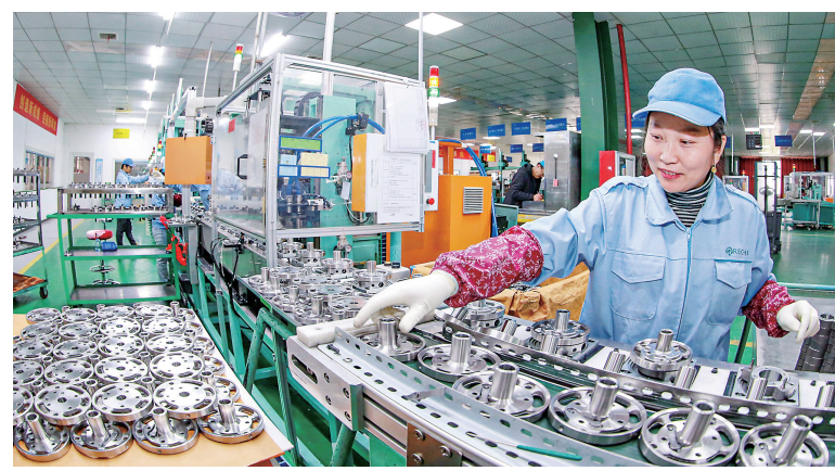
瑞智(九江)精密机电有限公司为台湾瑞智集团在国内投资设立的第4座生产基地。