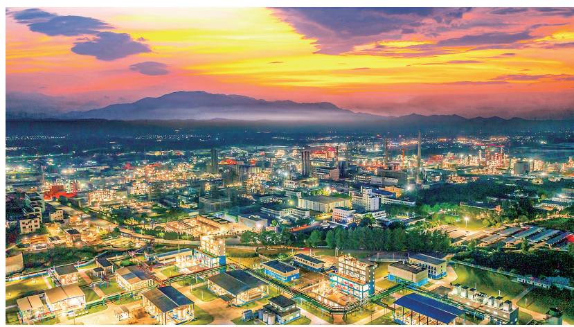
永修具有有机硅产业是我国有机硅工业的“摇篮”,也被誉为“有机硅之都”。