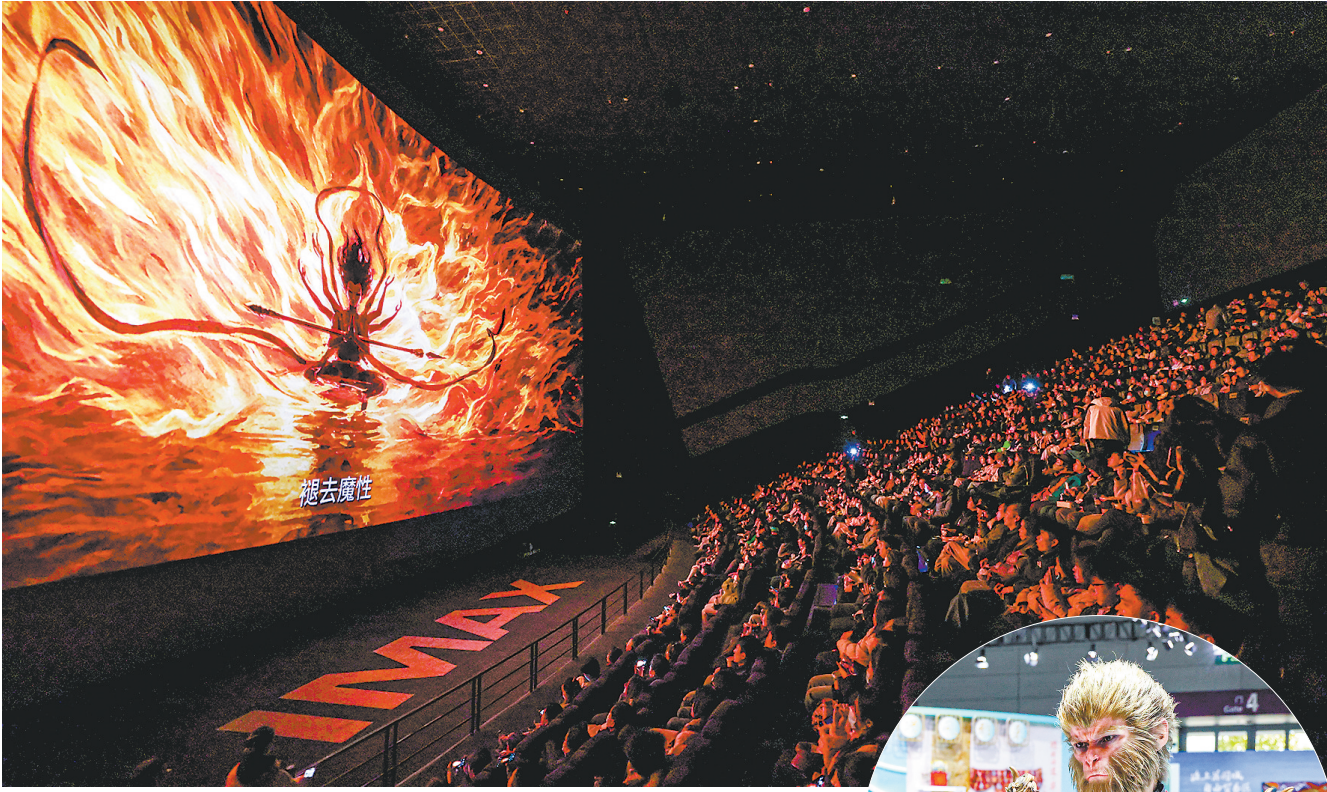
▲观众在影厅内观看电影《哪吒之魔童闹海》。